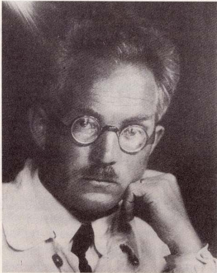
„Ein Leben für die Landschaft“