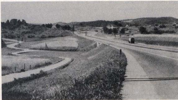
Kurvenschwung der Autobahn, daneben Zickzack des bäuerlichen Fahrwegs (aus: Seifert, A. (1962): Ein Leben für die Landschaft)

bezeichnete und ab 1940 offiziell den Titel „Reichslandschaftsanwalt“ führte. Landschaftliche Eingliederung bedeutete für ihn Trassenführung mit möglichst geringer optischer Zerschneidung, standortgerechte Bepflanzung, aber auch ein volkspädagogisches Anliegen: Der Volkswagen fahrende „Volksgenosse“ sollte im Durchfahren Deutschlands ein Gefühl für die unterschiedlichen Landschaftseigenheiten bekommen. Das ist der Grund, weshalb z.B. die Autobahn München-Salzburg in der Schotterebene schnurgerade, im Hügelland dann in großen Schwüngen geführt wurde und den Irschenberg als Aussichtspunkt mitnimmt, obwohl er auch zu umgehen gewesen wäre.