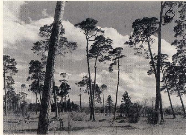
Urtümliche Föhrenbestände in der Pupplinger Au, Naturschutzgebiet "Flußbett der Isar und Isarauen bei Wolfratshausen (Oberbayern)" (Foto: Otto Kraus, ca. 1950)

seiner Arbeit vergaß er nie, die Verdienste anderer herauszustellen, z.B. der Regierungs- und Kreisbeauftragten für Naturschutz.