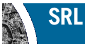
Johannes Dragomir Vereinigung für Stadt-, Regional- und Landesplanung e.V. Regionalgruppe Bayern

Die SRL erwartet sich vom "Bündnis zum Flächensparen" Vorschläge und Ergebnisse, die durch einen verantwortungsvollen Umgang mit allen Aufgaben der Planung und ihrer Umsetzung zumindest mittel- bis langfristig zu einer erheblichen Reduzierung des Flächenverbrauchs in Bayern führen werden.